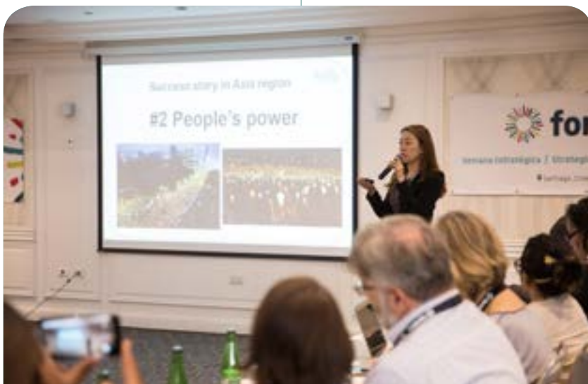
Asamblea General y Semana estratégica de Forus (Septiembre de 2018 - Santiago, Chile)

La estrategia de Forus en cuanto a sus miembros es garantizar que la mayoría de las plataformas nacionales y regionales llevan a cabo autoevaluaciones y procesos de análisis de necesidades y estén satisfechas con el apoyo técnico brindado por Forus y las coaliciones regionales. En este orden de cosas, en 2018 se realizó la Encuesta a los miembros , un amplio cuestionario que recoge información sobre nuestros miembros en cuanto a prioridades y actividades, gobernanza, servicios a ONG locales afiliadas, contexto nacional y alianzas. Esta encuesta proporciona a Forus información precisa y actualizada sobre nuestros miembros y una base