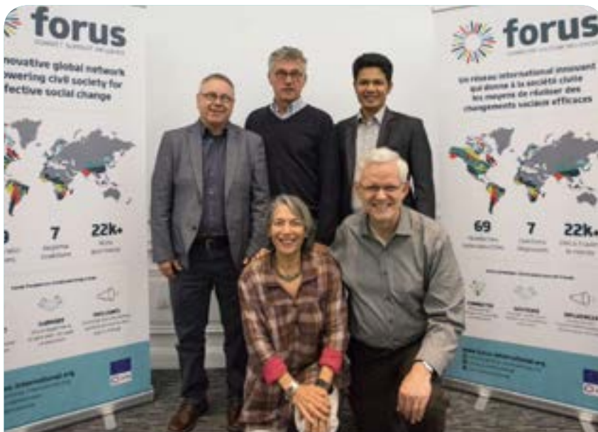
Comité ejecutivo de Forus (Septiembre de 2018 - Santiago, Chile)