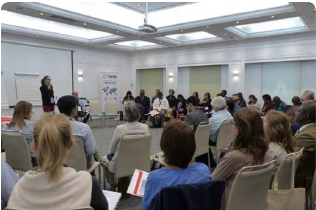
Intercambios entre pares y taller de aprendizaje con los miembros de Forus (Septiembre de 2018 - Santiago de Chile)

Entre los proyectos conjuntos llevados a cabo en el continente africano se encuentra, por ejemplo, ZCSD (Zambia), que ha mejorado sus capacidades organizando una actividad de formación sobre gestión de páginas web y redes sociales. Los miembros y empleados también tomaron parte en actividades encaminadas a desarrollar indicadores para el Marco Nacional de Reducción de la Pobreza de Zambia. En Senegal, la plataforma nacional CONGAD (Conseil des ONG d'Appui au Développement) participó activamente en el comité técnico responsable de la preparación y el seguimiento de los exámenes nacionales voluntarios (VNR, por sus siglas en inglés) establecidos por el Gobierno de Senegal y contribuyó con un informe de OSC, con el apoyo de Forus.