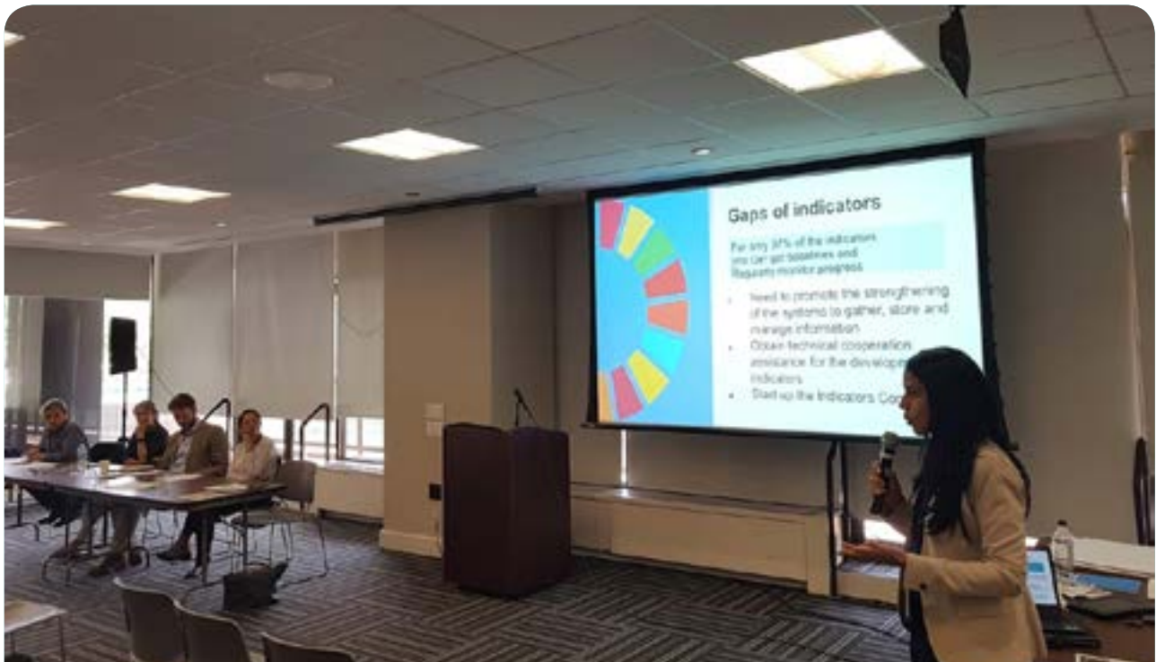
Foro político de alto nivel (Julio de 2018, Nueva York)