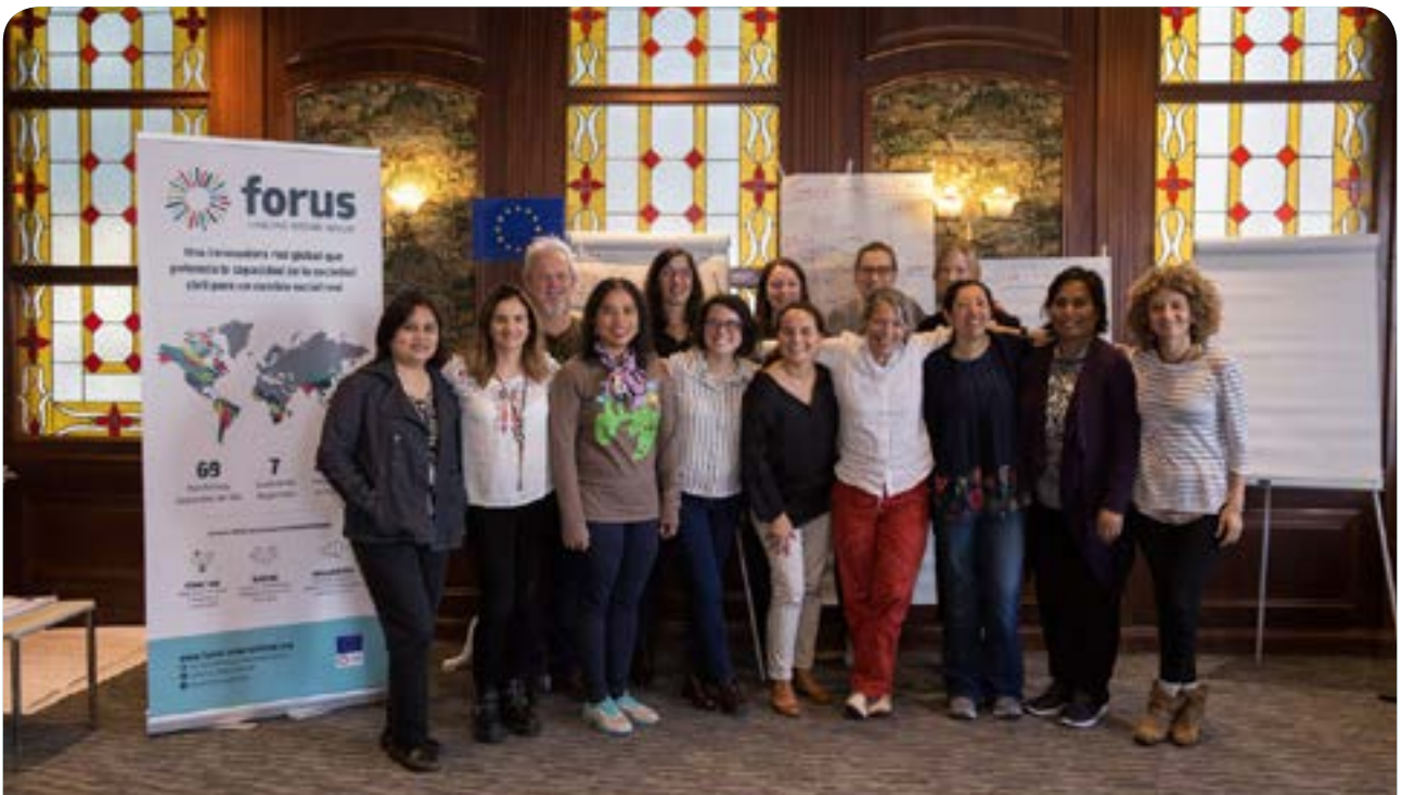
Programa de desarrollo del liderazgo, ciclo 2 (Septiembre de 2018 - Santiago, Chile)

y reunió a doce participantes en el aprendizaje entre pares en línea y presencialmente sobre habilidades de liderazgo, de manera que ayudó a identificar enfoques innovadores para mejorar la labor de las ONG. El seminario presencial de este primer ciclo se realizó del 18 al 21 de noviembre de 2017 en Dhulikhel (Nepal). Para elegir a los participantes se empleó un mecanismo de selección entre pares. Durante el programa, los participantes cuestionaron el proceso de aprendizaje y la forma de trabajar de sus respectivas plataformas, y extrajeron aprendizajes sobre participación y liderazgo, incluidas preguntas sobre los objetivos de cambio social de la plataforma. Para los participantes más jóvenes, supuso una ocasión para ampliar su visión sobre el papel de las plataformas nacionales y las posibles acciones que pueden llevarse a cabo. Sus aportaciones se publicaron en nuestra página web , Twitter o Facebook . Asimismo, se ha desarrollado un vídeo sobre el primer