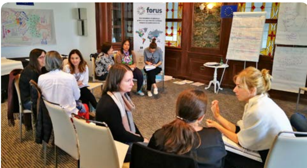
Programa de desarrollo del liderazgo, ciclo 2 (Septiembre de 2018 - Santiago, Chile)