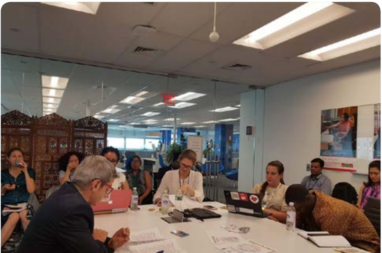
Forum politique de haut niveau (Juillet 2018, New York)

Cette plateforme autonome de la société civile permet aux OSC d'identifier de meilleures façons d'entrer en lien sur des problématiques et dans différents pays, de promouvoir l'apprentissage et la collaboration et plus particulièrement sur tout