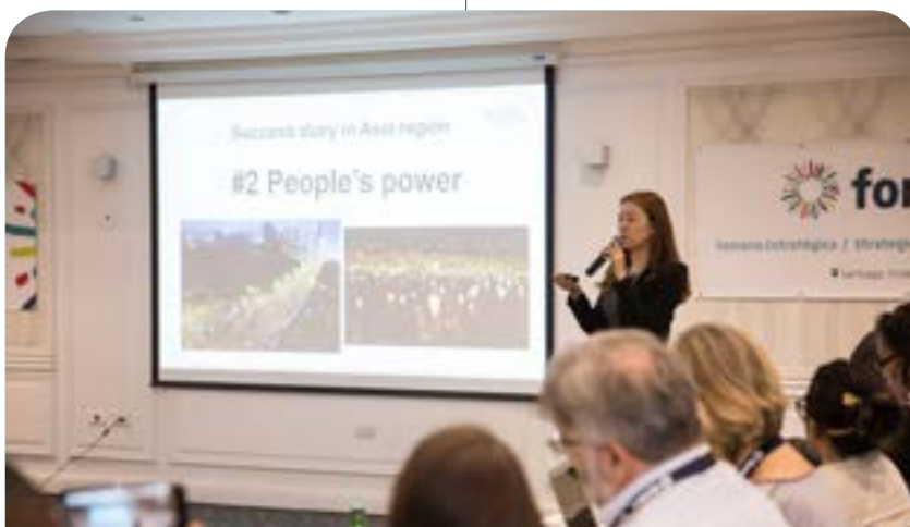
Assemblée générale et Semaine stratégique de Forus (Septembre 2018 - Santiago, Chili)

La stratégie de Forus en ce qui concerne ses membres est de s'assurer que la majorité des plateformes nationales et régionales participent aux auto-évaluations et aux processus d'examen des besoins et qu'ils soient satisfaits du soutien technique fourni par Forus et par les coalitions régionales. Dans cette perspective, le sondage des membres,