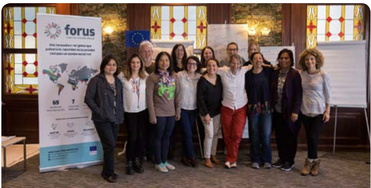
Programme de développement du leadership, cycle 2 (Septembre 2018 - Santiago, Chili)

Le premier cycle du Programme de développement du leadership (LDP) a eu lieu de juin 2017 à avril 2018 et a réuni 12 participants pour un apprentissage en ligne et en présentiel entre pairs sur les sujets des compétences de leadership et de l'identification des approches innovantes visant à améliorer le travail des ONG. L'atelier en présentiel de ce premier cycle s'est tenu du 18 au 21 novembre 2017 à Dhulikhel (Népal). La sélection des participants a été effectuée selon un mécanisme de sélection par les pairs. Lors du programme, les participants