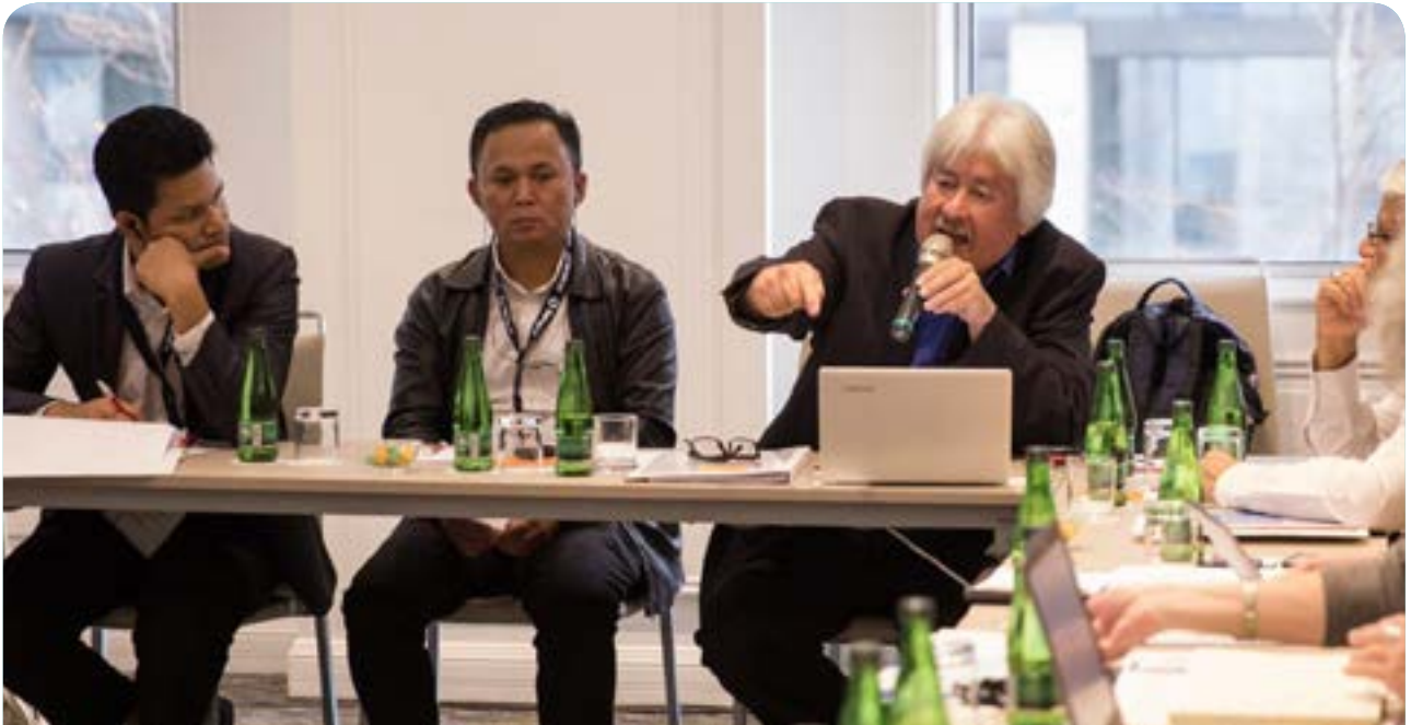
Assemblée générale et Semaine stratégique de Forus (Septembre 2018 - Santiago, Chili)