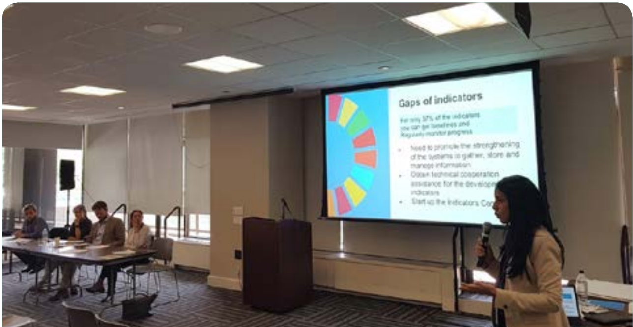
Forum Politique de haut niveau - FPHN (Juillet 2018, New York)