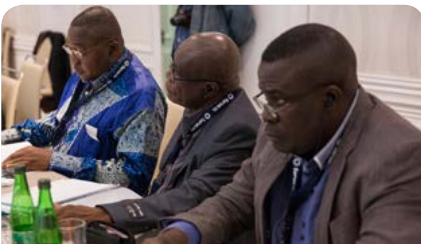
Assemblée générale et Semaine stratégique de Forus (Septembre 2018 - Santiago, Chili)

La conférence inaugurale de philosophie du Pacifique (CIPP) a eu lieu du 11 au 14 juin 2018 et a réuni 161 participants représentant plusieurs pays de la région. Son thème était le suivant : « Vuku ni Pasifika - Sagesse dans le Pacifique : Les philosophies de vie relationnelles des populations indigènes », et était organisé par PIANGO et trois universités : le Collège de théologie du Pacifique, l'Université du Pacifique Sud et l'Université nationale des Fidji. Elle a réuni des personnes âgées et des détenteurs de la sagesse, du savoir, de la culture, des danses, des arts et de la navigation du Pacifique autour d'un dialogue critique afin d'offrir des bases philosophiques au débat « Remodeler le Pacifique que nous voulons ». PIANGO est à l'avant-garde de la recherche de références alternatives de développement prenant en considération le contexte et le monde du Pacifique afin de l'aider à redessiner son développement.